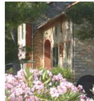
Château de la Pascalette